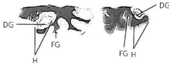
Fig. 1. Muestra un corte del hipocampo de una persona control (izquierda) y de otra con síndrome de Down (derecha). Se aprecia que el tamaño del hipocampo es menor en el síndrome de Down. Según Silvestre [38].

En otro estudio se comprobó que en el 33% de los casos se produce un estrechamiento de la circunvolución temporal superior (CTS) en uno o en ambos hemisferios, con ensanchamiento de la cisura de Silvio y acortamiento de los lóbulos frontales, lo que produce anomalías importantes del lenguaje (más expresivas que receptoras) [7].